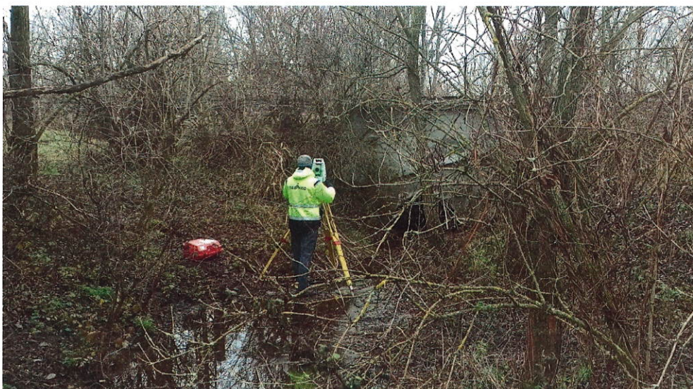
Obr. č.3: Geodetické zameranie skutkového stavu priepustu