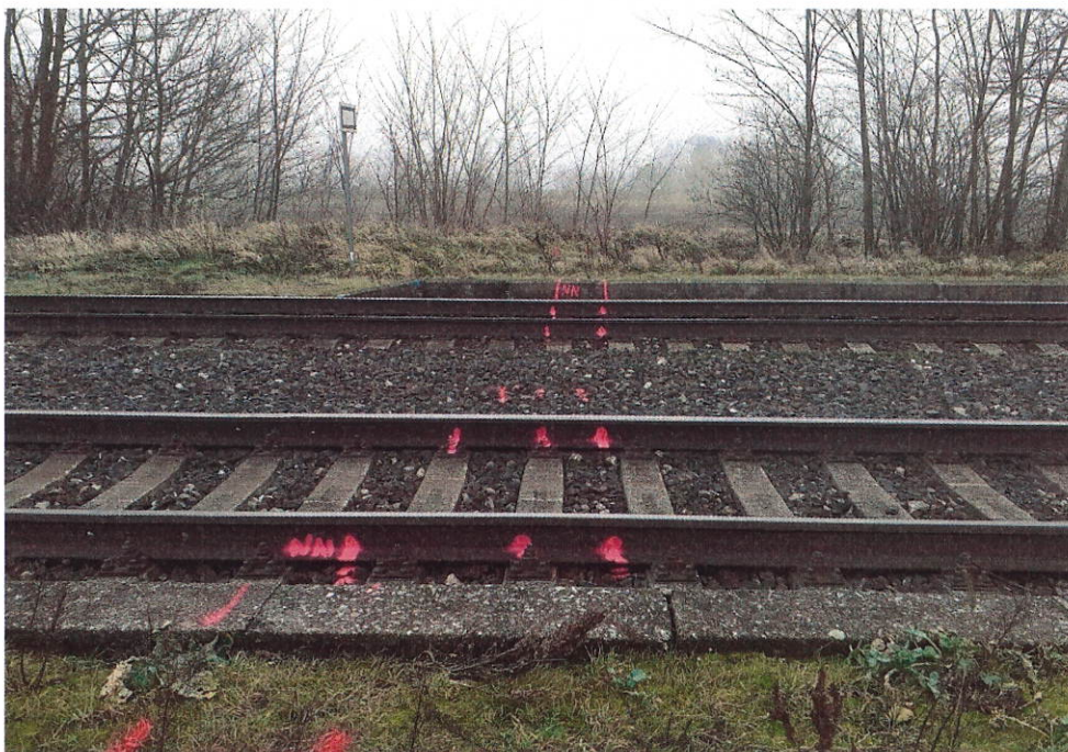
Obr. č.2: Zameriavanie stavby a stavebných objektov