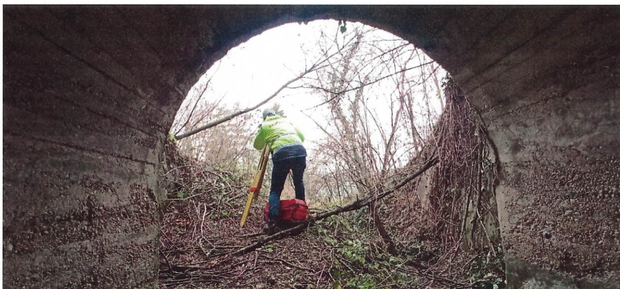
Obr. č.4: Ukážka zamerania a spracovania mosta v žkm 1,871.